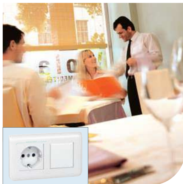
Рестораны | Mosaic™ | Розетка 2К+3 и выключатель