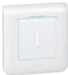
787 12 + 787 22