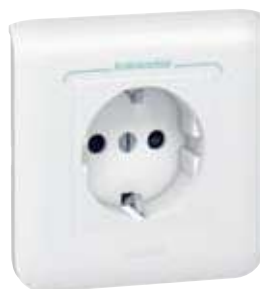
787 02 + 787 22