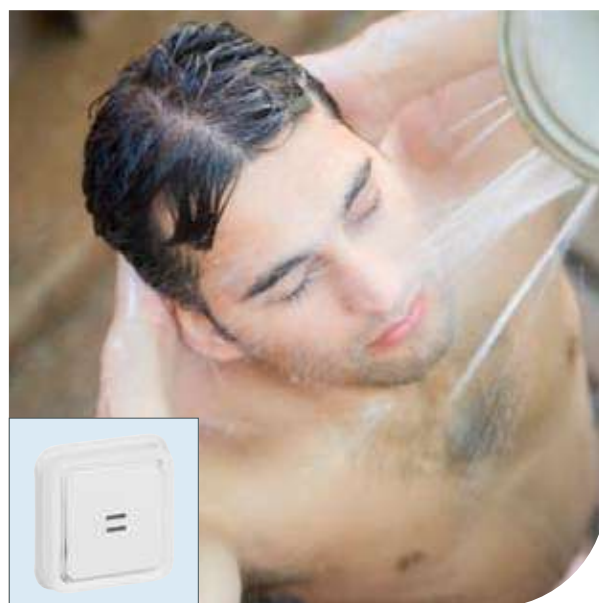
Бассейны | Plexo™ Artic | Выключатель с индикатором