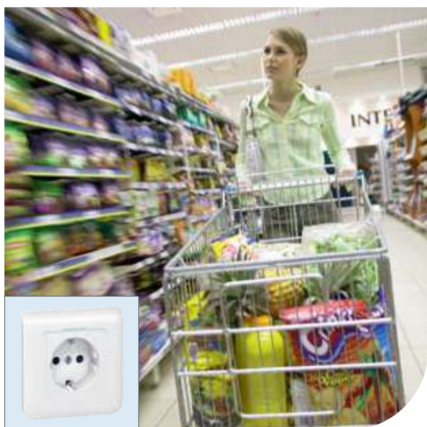
Супермаркеты | Mosaic™ | Розетка 2К+3