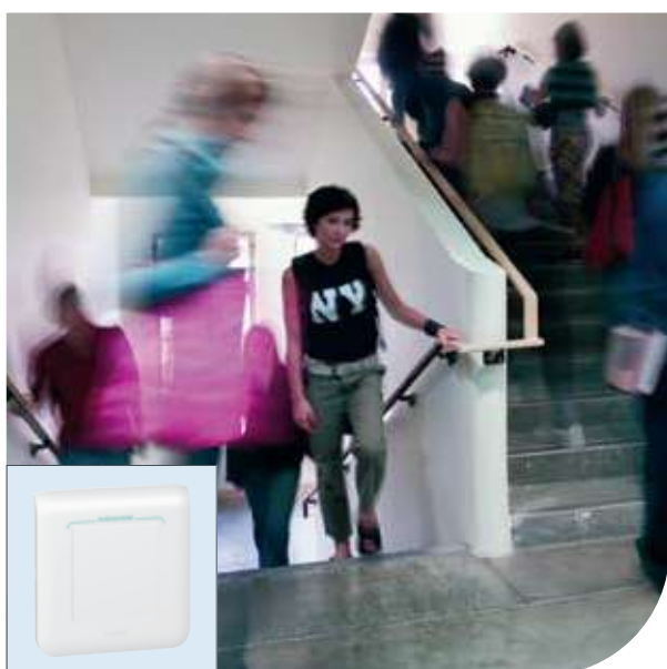
Образовательные учреждения | Mosaic™ | Выключатель одноклавишный