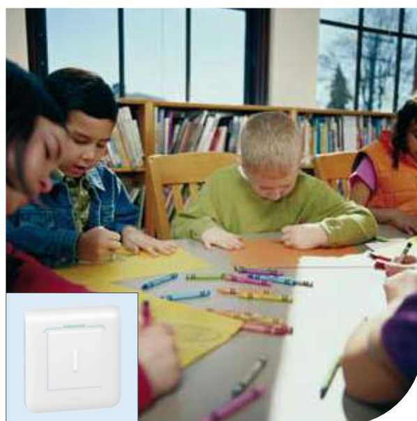
Дошкольные учреждения | Mosaic™ | Выключатель на 2 направления