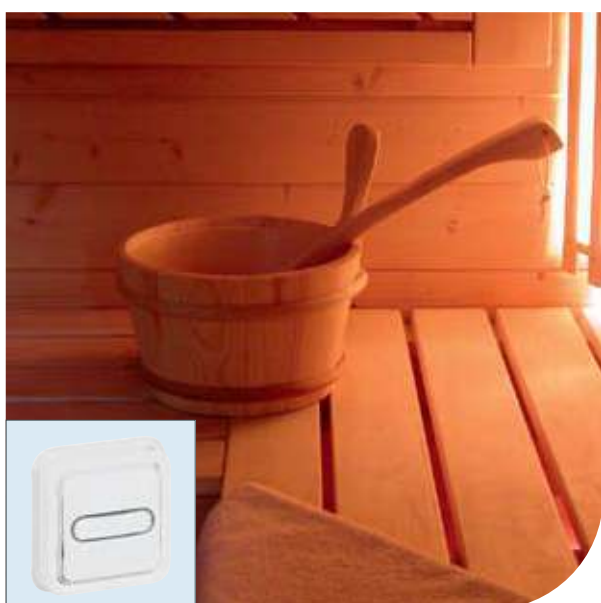
Сауна | Plexo™ Artic | Кнопочный выключатель с подсветкой