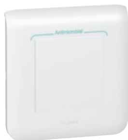
787 11 + 787 22