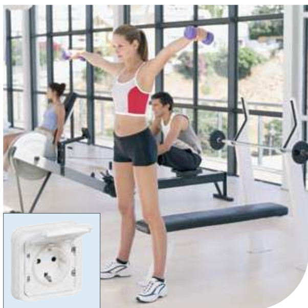
Фитнесс-клубы | Plexo™ Artic | Розетка 2К+3